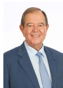
Patrick Ollier Maire de Rueil-Malmaison Ancien ministre Président de la Métropole du Grand Paris